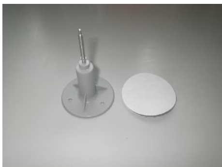
ダディロングレッグに付属しているガスケットと台座部分